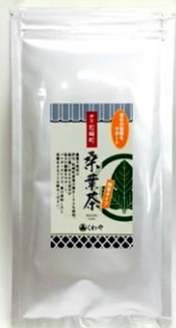
桑葉茶 粉末 60g ¥1,000(税別)

伊豆松崎産桑葉使用。丁寧に石臼で 挽いた桑葉はきめ細かいパウダーで さっと溶けやすく香りも豊かです。