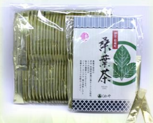
桑葉茶 粉末スティック1g 20個入 1,000(税別)